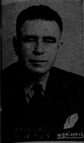
Don OTILIO ULATE B.

El 8 de noviembre de 1949 asumió el poder don Otilio Ulate Blanco en circunstancias sumamente difíciles a causa de la guerra civil que hacía año y medio no más había ocurrido.