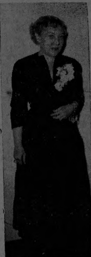
Sra. Amalia de Castillo Ledón, Presidenta de la Unión Interamericana de Mujeres.

El moderno feminismo no va contra los hombres, sino que los ayuda en realidad. Las mujeres quieren ahora la oportunidad de estudiar de qué manera pueden contribuir más extensamente a la cultura de sus países