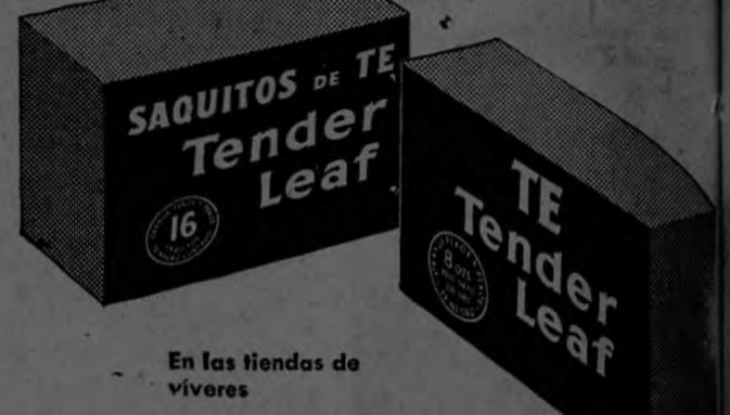
En las tiendas de viveres